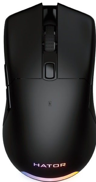
HTM-530 (Black) HTM-531 (White) HTM-532 (Yellow) HTM-533 (Mint) HTM-534 (Lilac)