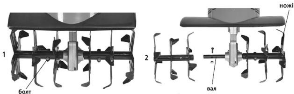
Рис. Заміна фрез